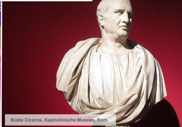
Büste Ciceros, Kapitolinische Museen, Rom.