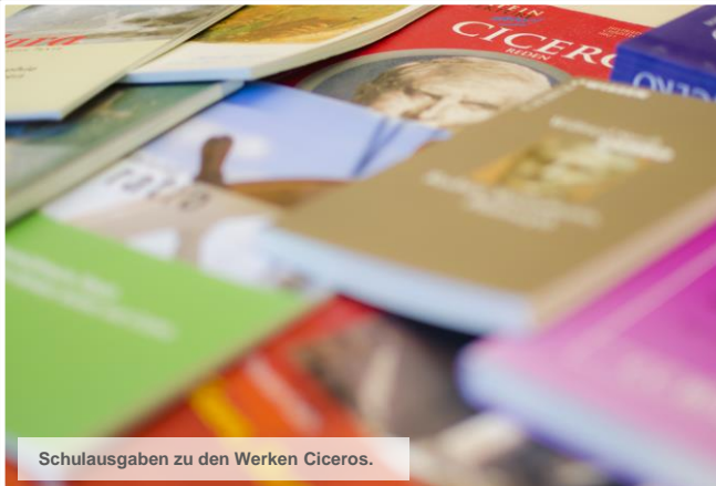
Schulausgaben zu den Werken Ciceros.